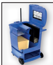
PLAN EN COUPE