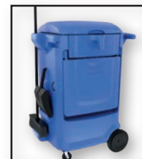
OUTILS À PORTÉE HYPER-MOBILITÉ