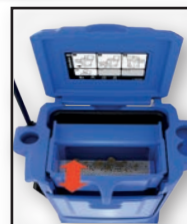
TAMISAGE PAR VIBRATION